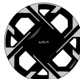
18-calowe felgi aluminiowe, wersja L oraz Business Line