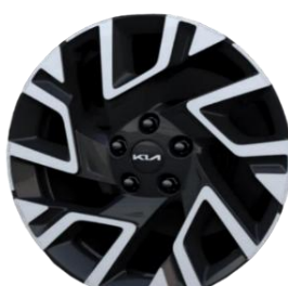
18-calowe felgi aluminiowe, wersja M + A18