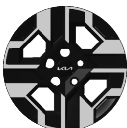
16-calowe felgi aluminiowe, wersja M