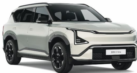
Ivory Silver (ISG) lakier metalizowany