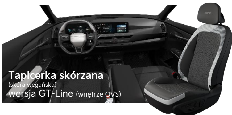
Tapicerka skórzana (skóra wegańska) wersja GT-Line (wnętrze OVS)