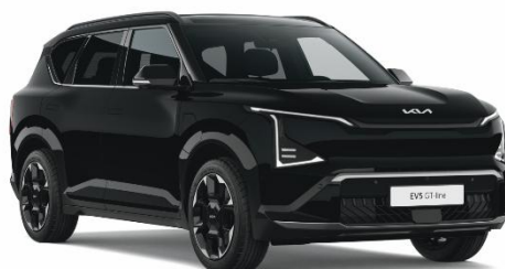
Fusion Black (FSB) lakier metalizowany perłowy