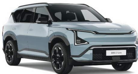
Frost Blue (EBB) lakier pastelowy bez dopłaty