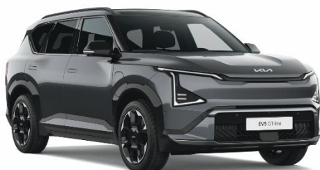
Gravity Grey (KDG) lakier metalizowany perłowy