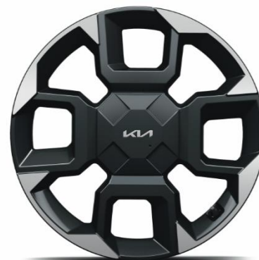
19" felgi aluminiowe, wersja GT-Line