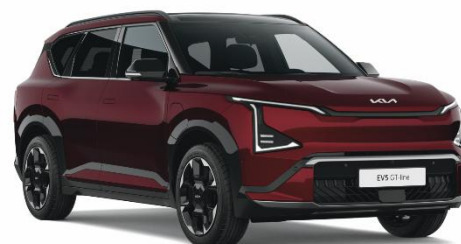
Magma Red (OVR) lakier perłowy