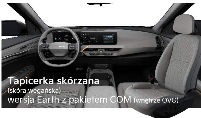
Tapicerka skórzana (skóra wegańska) wersja Earth z pakietem COM (wnętrze OVG)