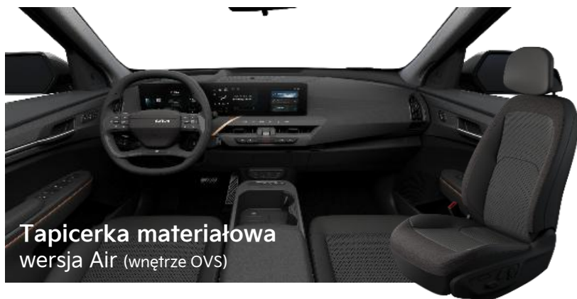
Tapicerka materiałowa wersja Air (wnętrze OVS)