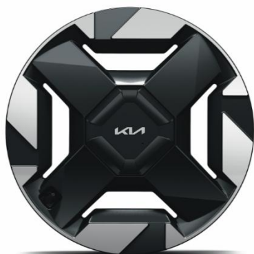
18" felgi aluminiowe, wersja Air