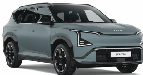
Iceberg Green (IEB) lakier matowy nieдоступny dla wersji Air