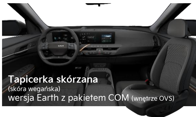
Tapicerka skórzana (skóra wegańska) wersja Earth z pakietem COM (wnętrze OVS)