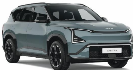
Iceberg Green (IEG) lakier metalizowany perłowy