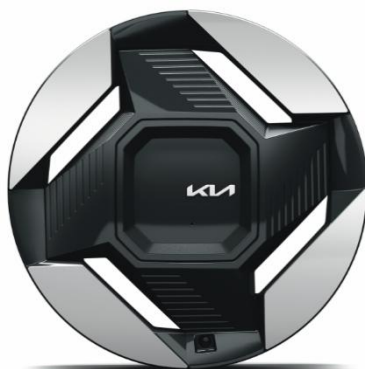
19" felgi aluminiowe, wersja Earth