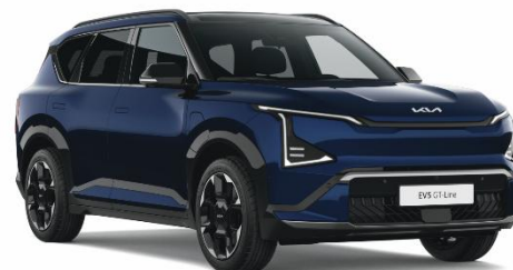
Dark Ocean Blue (BU3) lakier perłowy