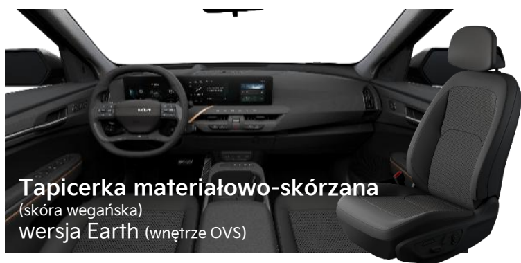
Tapicerka materiałowo-skórzana (skóra wegańska) wersja Earth (wnętrze OVS)